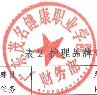
表 2 护理品牌专业建设资金使用明细表 (单位: 万元)