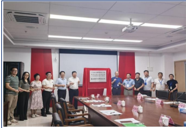
图6 与电白区中医院共建临床教研室