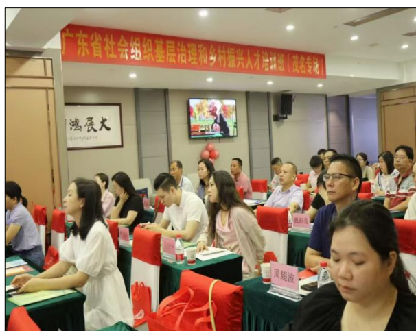
图 16 广东省社会组织基层治理和乡村振兴人才培养

本专业立足粤西地区发展需求，深度融入乡村振兴战略，通过多层次、多维度服务培育基层护理力量。聚焦乡村康养产业升级，为广东省乡村振兴人才开展养老知识培训。深化产教协同育人，开展了广东农垦高素质农民培训康养护理班、广东省社会组织基层治理和乡村振兴人才培养（茂名专场）、茂名地区养老院院长知识培训，推动了镇村康养产业高质量发展。与茂名市民政局联合举办的养老护理员培训班以及茂南区鳌头镇 2025 年度乡村振兴干部专题培训班，受到广泛报道。同时师生团队深入乡村一线，连续多年开展“百千万工程”突击队行动暨“三下乡”社会实践，驻点基层实施科技文化卫生服务，获评省级优秀集体、茂名市先进基层党组织。联合地方政府开展非遗文化传承活动，以文化赋能乡村建设，构建“教育帮扶+技能培训+产业联动+文化传承”的乡村振兴服务闭环。