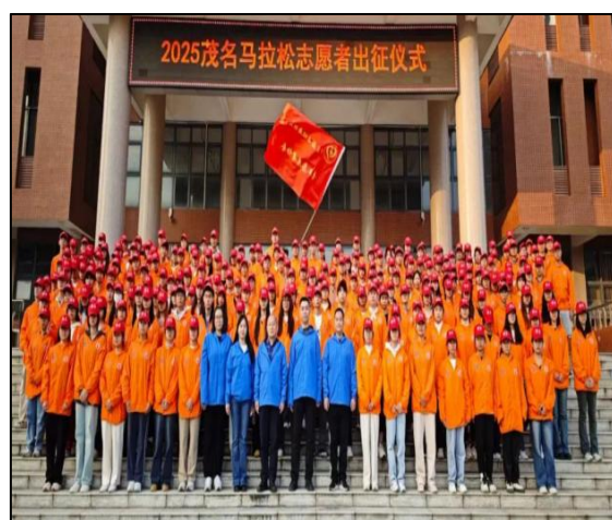
图 19 学院 1700 名志愿者助力“茂马”