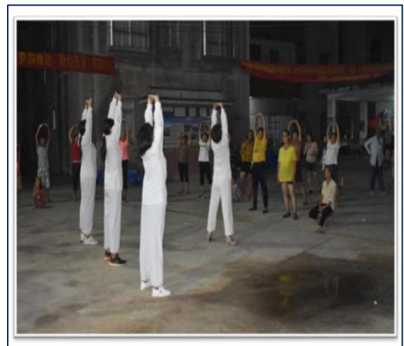
图 12 带领村民学习八段锦健身操