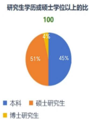
图1 研究生学历或硕士学位以上比例