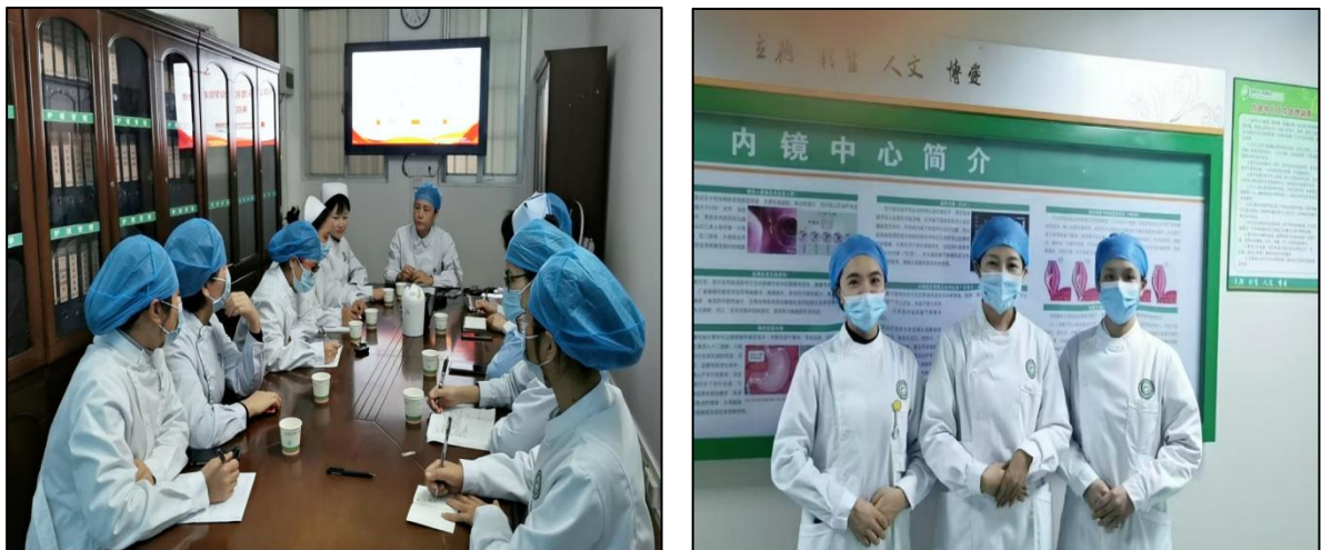
图 10 学院教师赴医院考察交流

直属附属医院及校外实践基地，按现代护理实训标准完善虚拟仿真实训室硬件设施，增购高危妊娠护理模拟人、智能老年穿戴等设备，搭建“虚拟仿真+临床真实”双轨实训平台。联合医疗机构开展“双导师制”培养，由医院临床导师与校内专任教师共同指导临床实践，从而打造“标准制定-课程开发-实践训练-服务反哺”全链条育人体系，实现教学场景与临床岗位“零距离”对接，形成“校院共育、能力递进”的护理人才培养范式。