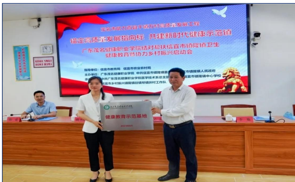
图 15 开展信宜市镇隆镇卫生健康教育结对帮扶工作

我校基于“政-校-行-企”四维联动健康服务体系，通过深化校地协同发展机制，主动面向相关行业、企业开展企业员工和行业从业人员的新业务、新知识的相关培训，培训 1000 余人。护理专业组建的标准化志愿服务团队建立“赛事医疗+社区健康”双轨服务机制，每年为粤西地区各大公益事业、大型赛事提供医疗志愿服务，为茂名马拉松比赛、信宜自行车大赛等提供志愿服务。同步与粤西地区各中小学联合开展中医药文化、急救技能等主题研学课程、研学活动，组织开展科普活动，成功获得广东省科普教育基地、广东省社会科学普及基地、潘茂名中医药文化科普基地、茂名市中小学生研学实践教育基地等荣誉称号。推进实施全口径、全方位融入式结对支持粤西地区基础教育工作，开展信宜市镇隆镇卫生健康教育结对帮扶工作，与信宜市 8 所中小学形成结对帮扶服务，反哺基础教育，服务满意度达 98.6%。