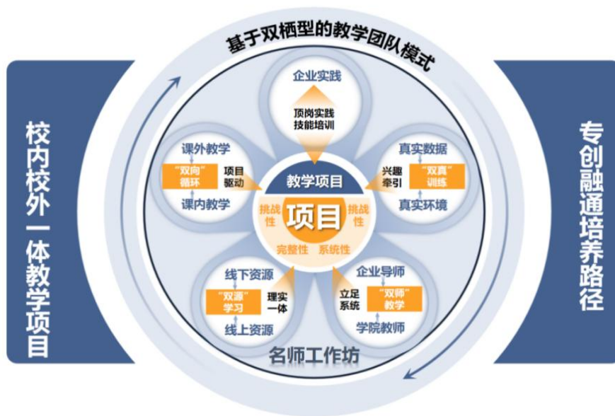
图9 “双栖型”教学团队构建模式