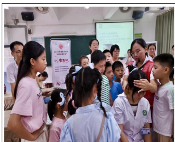
图 18 “小小中医师”亲子课堂

本专业构建“基地-平台-活动-服务”四位一体的科普教育体系，全力推进健康知识全民普惠。依托广东省科普教育基地、中医药文化科普基地等省级平台，制定应急救护技能培训三年行动计划，面向公众开展心肺复苏、创伤救护等培训超6万人次，获评“全国急救示范校”“广东省红十字标准校”。联动粤西地区中小学开展中医药文化研学、急救知识科普等专题活动，惠及逾万名青少年。组建专业志愿服务队，为茂名马拉松、信宜自行车赛等大型赛事提供赛事医疗保障，并成立社区服务站提供免费健康体检。同时，将科普教育融入产教融合，作为全国中医康养创新创业产教融合共同体轮值单位，联合全国院校推广医卫教育成果。师生团队通过“三下乡”活动将健康宣教覆盖至偏远乡村，形成“基地辐射全域、活动贯穿全年、服务惠及全民”的立体化科普矩阵，有效提升区域公众健康素养。