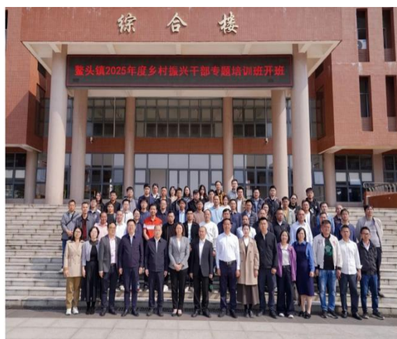
图 17 为鳌头镇乡村干部“充电蓄能”