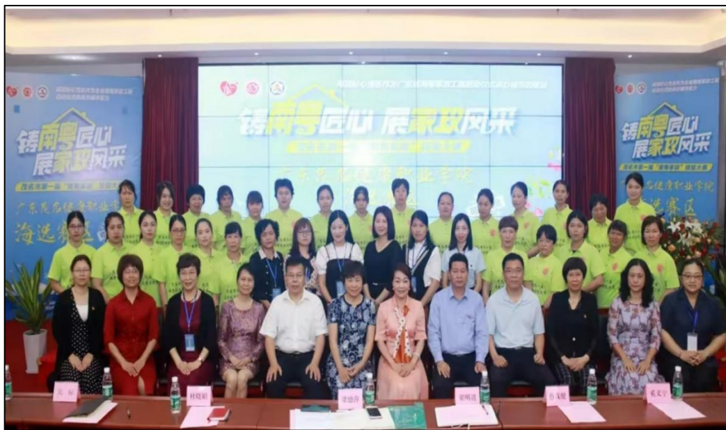
图8 学校承办广东省好心家政集团的“南粤家政”技能大赛

策”等纳入考核，通过标准化病人情境模拟、服务对象满意度调查量化人文素养，建立德育学分档案。委托第三方机构开展毕业生跟踪调查，重点监测岗位适应度、职业忠诚度、满意度等指标，定期发布专业群人才培养质量报告，形成“评价-反馈-改进”闭环机制，全面实现“技能硬实力+人文软实力”双维度考核。