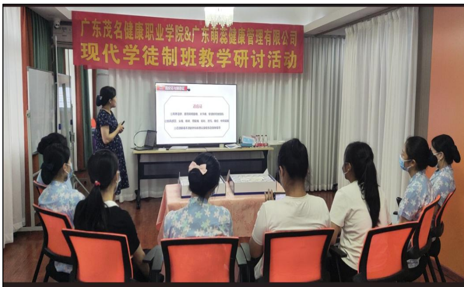
图 5 赴广东萌蕊健康管理有限公司进行教学活动研讨会

系与评价标准，依托 45 个教学基地构建“医院课堂+企业工坊”双元培养模式，与三甲医院、养老机构合作开展“订单班”“学徒制”项目，开发职业岗位技术标准，形成“院校双导师、教学双场景、考核双维度”的育人路径。校企共商、共建“模块化课程体系”，开发《老年人生活能力康复训练》《内科护理学》等产教融合课程，充分实现护理技能训练与职业等级证书培训的阶梯式衔接。实施校企“双向流动”机制，建立校企联合党支部与“双栖型”教学团队工作室，聘请行业领军人才、技能大师担任产业导师，推动专兼职教师共研课程标准，将医院、企业真实案例融入课程标准，形成“临床专家进课堂、教师进病房”的常态化互动模式。