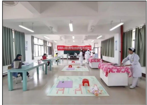
图7 1+X 证书” 幼儿照护职业技能 考试现场