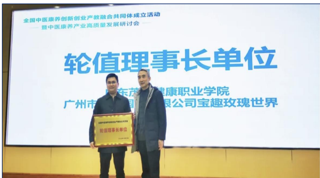
图 14 当选为全国中医康养创新创业产教融合共同体轮值理事长单位

本专业紧密对接粤西大健康产业发展需求，构建“产学研用”一体化服务体系。主动面向行业企业开展技术服务、成果转化，通过人民卫生出版社、西安交通大学出版社学术交流平台对全国医卫类高职院校、中职学校进行推广交流，在益阳医学高等专科学校、仙桃职业学院、湖北三峡职业技术学院等学校进行成果推广转化。搭建产学研结合的技术推广服务平台，建立终身教育品牌项目：“让技术为养老赋能——打造智慧助老粤西一堂课”教育品牌，成功立项国家智慧助老典型教育项目，为推动粤西地区养老赋能。同时加强与其他院校共建，共同参与组成的全国中医康养创新创业产教融合共同体，选为全国中医康养创新创业产教融合共同体轮值理事长单位。