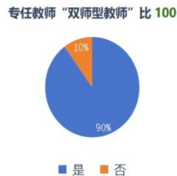
图3 专任教师“双师型教师”比例