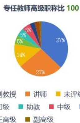
图2 专任教师高级职称比例