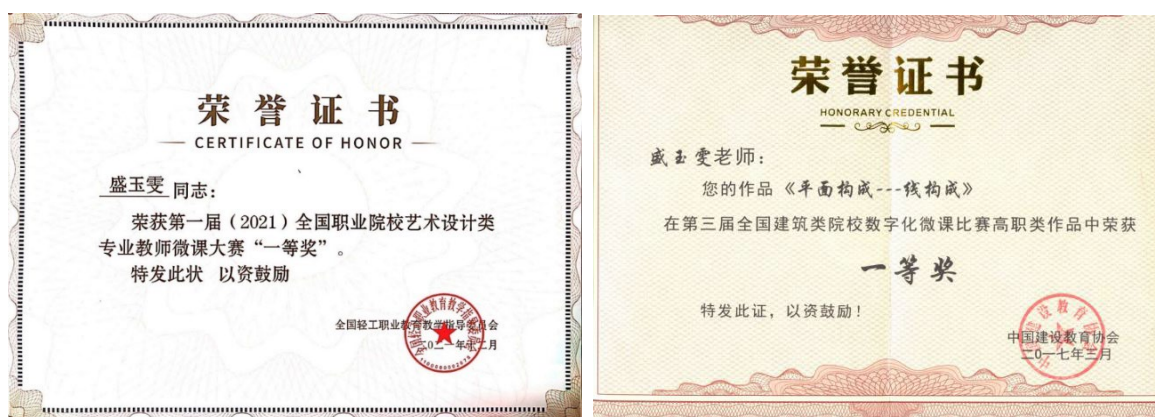
图 8：荣获全国职业院校、行业协会教师微课大赛一等奖