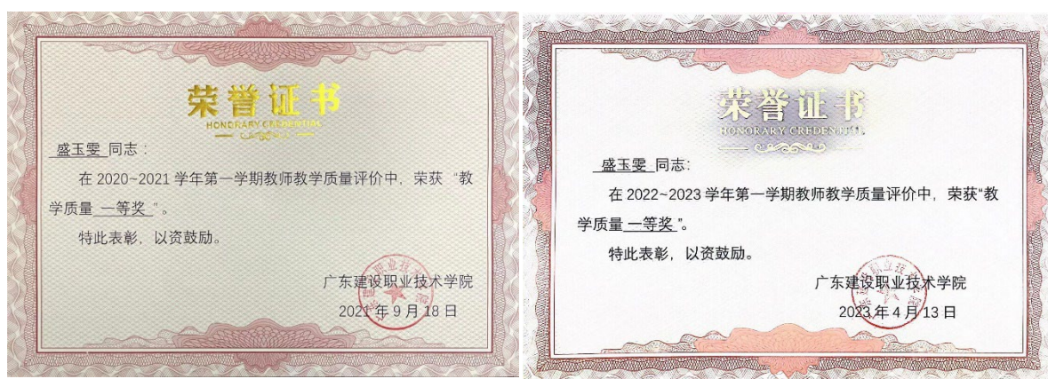
图 9：近五年连续荣获校级教学质量一等奖