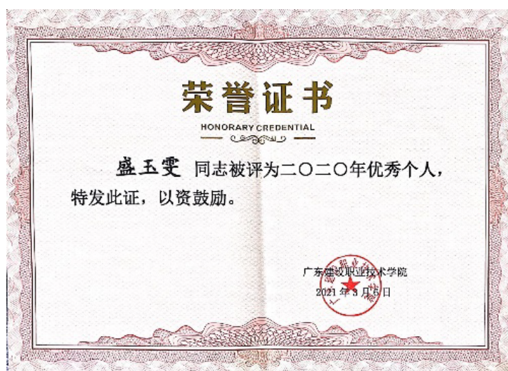
图 10：2021 年荣获 2020 年优秀个人称号