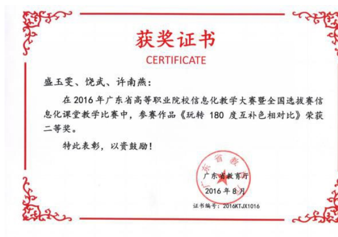
图 7：荣获广东省职业院校信息化大赛教学设计一等奖、课堂教学二等奖